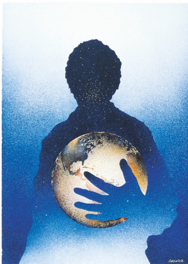
Il ne faut pas tuer la terre, on ne saurait pas où l'enterrer... Michel Granger