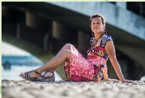
Moka Jazz

Des marches emblématiques ont en commun la volonté de transmettre un message d'union, de non-violence, de justice et de paix. Elles nous invitent aux évolutions les plus positives de nos sociétés. Que signifie aujourd'hui marcher ensemble, danser?